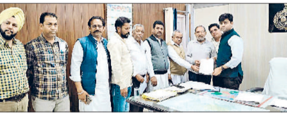
सिरसा। एसडीएम को ज्ञापन सौंपते कांग्रेसी।