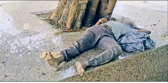
फतेहाबाद। जाखल रेलवे स्टेशन पर मृत पड़ा युवक।