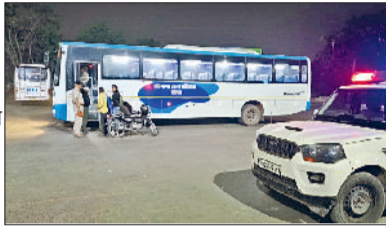
सिरसा। सिरसा के बस अड्डा में सर्व अभियान चलाती पुलिस टीम।