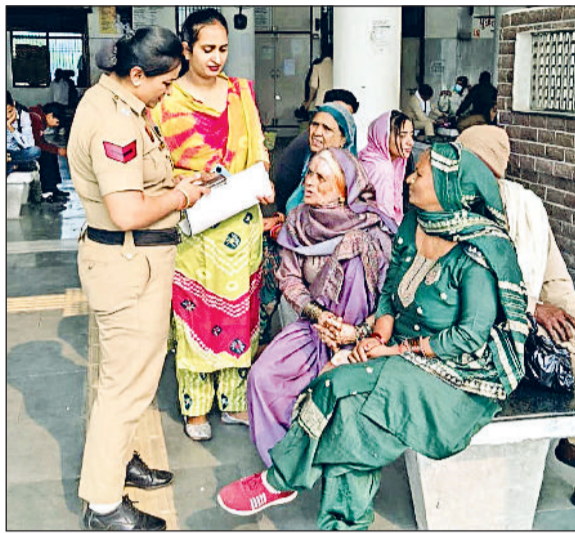
फतेहाबाद। बस स्टैंड पर महिलाओं से बातचीत करती महिला पुलिस कर्मचारी।

दिल्ली में लाल किले के पास हुए बम धमाके के बाद फतेहाबाद पुलिस अलर्ट मोड में आ गई है। जिले की पंजाब व राजस्थान से लगी सीमाओं पर नाकाबंदी कर वाहनों की गहन तलाशी ली जा रही है। जिले के जाखल, टोहाना व भद्र रेलवे स्टेशनों पर जीआरपी द्वारा भी मंगलवार को विशेष चैकिंग अभियान चलाया गया। रेलवे स्टेशन परिसर के हर हिस्से में चैकिंग की गई है और यात्रियों के सामान की बारीकी से जांच की गई। दिल्ली से आने वाली ट्रेनों, बसों और कारों पर पुलिस द्वारा नजर रखी जा रही है। जिलेभर में रेलवे स्टेशनों बस स्टैंड और नेशनल हाईवे पर चैकिंग अभियान मंगलवार को भी जारी रहा। फतेहाबाद में सभी पुलिसकर्मियों की छुट्टियां कैसिल कर दी गई है।