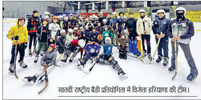
सातवीं राष्ट्रीय बैंडी प्रतियोगिता में विजेता हरियाणा की टीम।