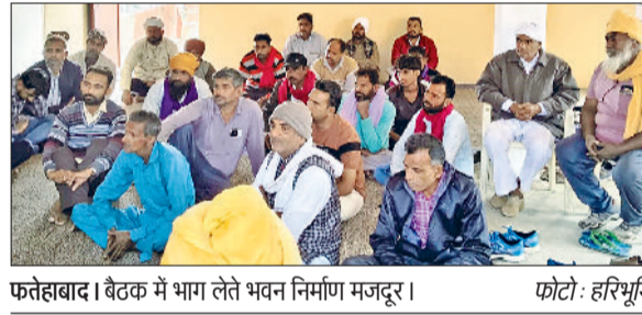
फतेहाबाद। बैठक में भाग लेते भवन निर्माण मजदूर।