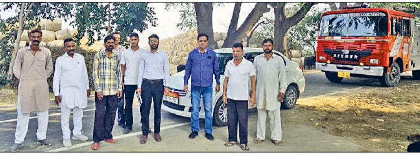
फतेहाबाद। गांवों का दौरा करते ग्राम स्तरीय टीम में शामिल अधिकारी।

फसल अवशेष प्रबंधन को लेकर उपायुक्त डॉ. विवेक भारती ने आज राजस्व व कृषि विभाग के अधिकारियों के साथ बैठक कर उन्हें जरूरी दिशा निर्देश दिए। बैठक में उपायुक्त ने सभी अधिकारियों व कर्मचारियों निर्देश दिए कि वे अपने क्षेत्र में रहकर लगातार किसानों से संपर्क कर उन्हें पराली प्रबंधन के लिए जागरूक करें ताकि किसी भी प्रकार की आगजनी की घटनाओं को शून्य स्तर पर लाया जा सके। इसके